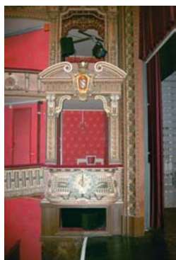
← Balcon du roi, côté jardin