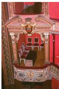
Balcon de la reine, côté cour →