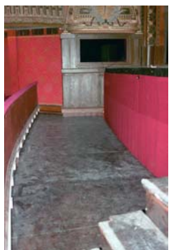
← La fosse à orchestre, qui, comme le porte son nom, est utilisée pour installer un orchestre.