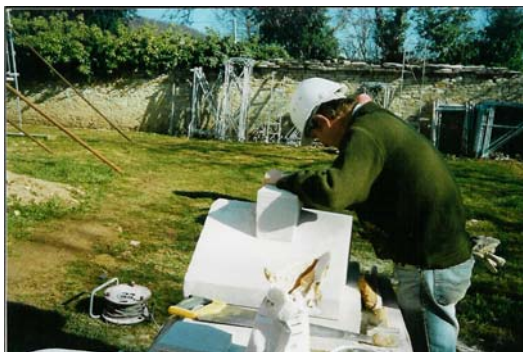
Taille de pierres