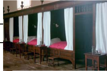
↑ Salle des femmes

La chapelle est surmontée d'un campanile (panneau de bois assemblés), la salle des femmes a été construite avec celle des hommes.