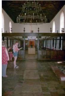
↑ Salle des hommes