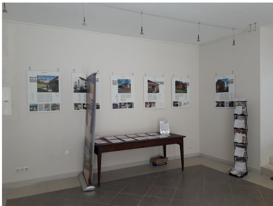
Espace Revermont - Brancion

Les travaux de réhabilitation ont été réalisés grâce au concours financier de la Fondation VINCI pour la Cité et dans le cadre du partenariat signé avec l'Entreprise Gasquet de Tournus.