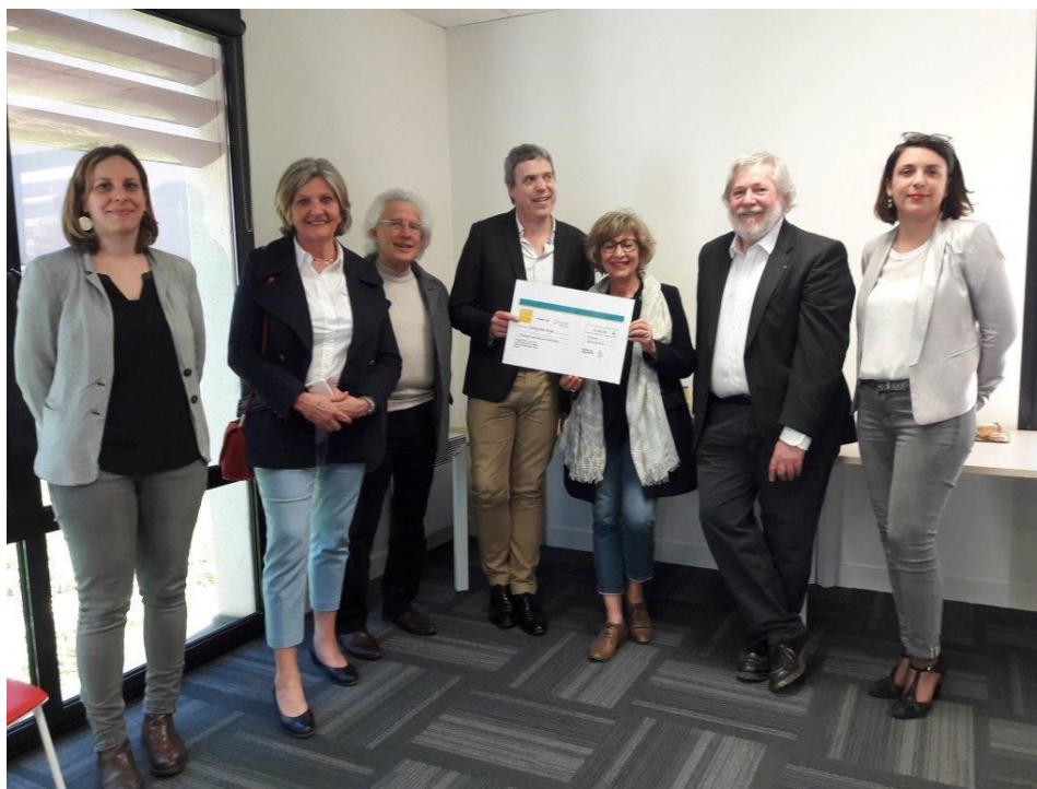
Remise de chèque - Entreprise Gasquet - Tournus