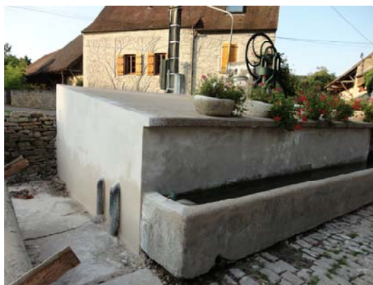
Reprise des maçonneries et enduits