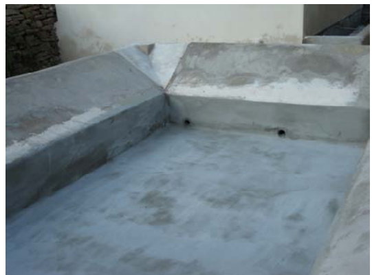
Réalisation de l'étanchéité du bassin et des marges