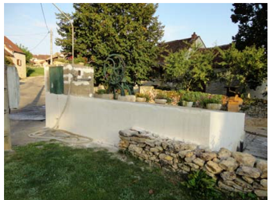
Reprise des enduits en deux couches