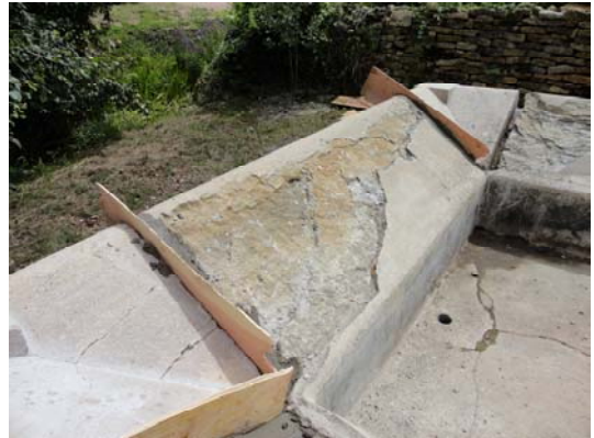
Décapage de maçonneries et des pierres