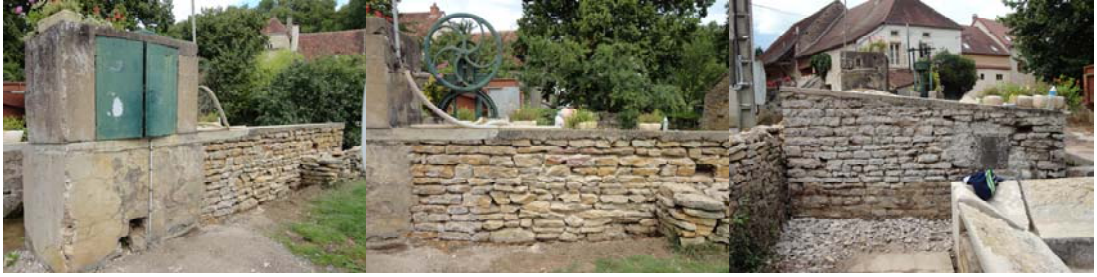
Piquetage des enduits ciment