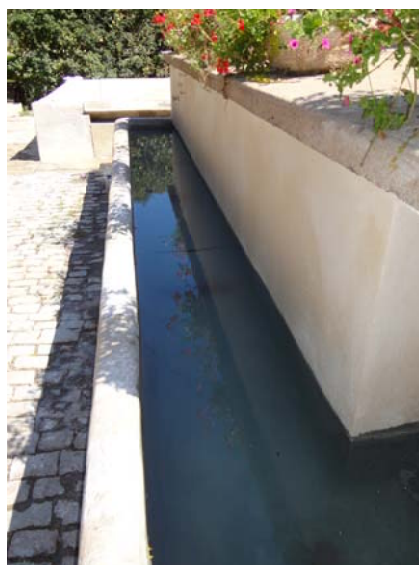
Étanchéité et remise en eau